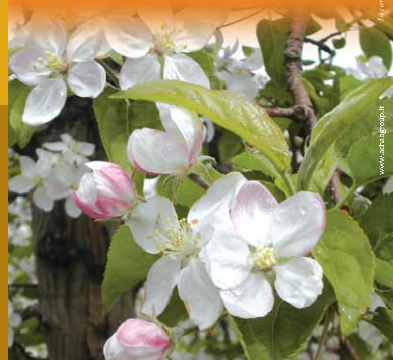
La carta che hai differenziato non è andata in discarica: è semita per ottenere carta riciclata come questa!